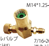
R1234yf 新型缶切りバルブ RH-40YF2N