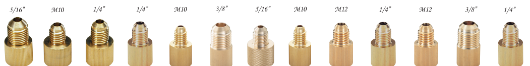
RH-159P-1 RH-159P-2 RH-159P-3 RH-159P-4 RH-159P-5 RH-159P-6 RH-159P-7 RH-159P-8 RH-159P-9 RH-159P-10 RH-159P-11 RH-159P-12 RH-159P-13