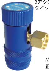
R1234yf 低圧 RH-40YF5